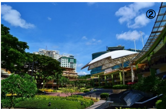
写真② アヤラショッピングセンター

セブ島で最初の日本人経営学校のビル型キャンパスです。1Fにセブンイレブン、カフェ、和食レストラン、マッサージ、薬局、近郊（徒歩圏内）にファストフード、スーパーマーケット、様々なレストランが御座います。