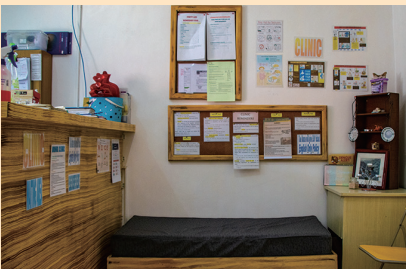
医療支援/クリニック