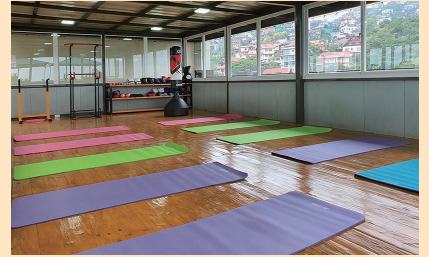
ヨガとボクシング