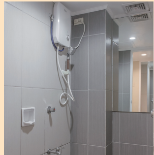
温水冷水シャワー