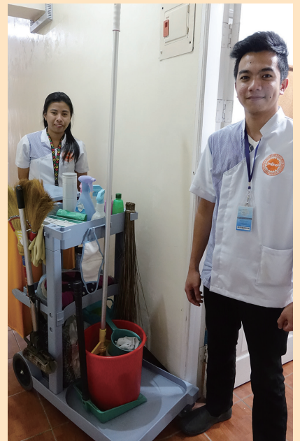
ハウスキーピングサービス