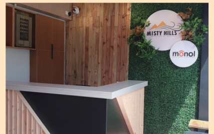
24時間365日体制のレセプション