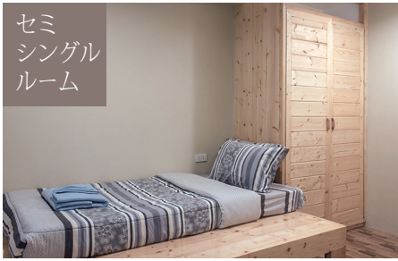
セミ シングル ルーム