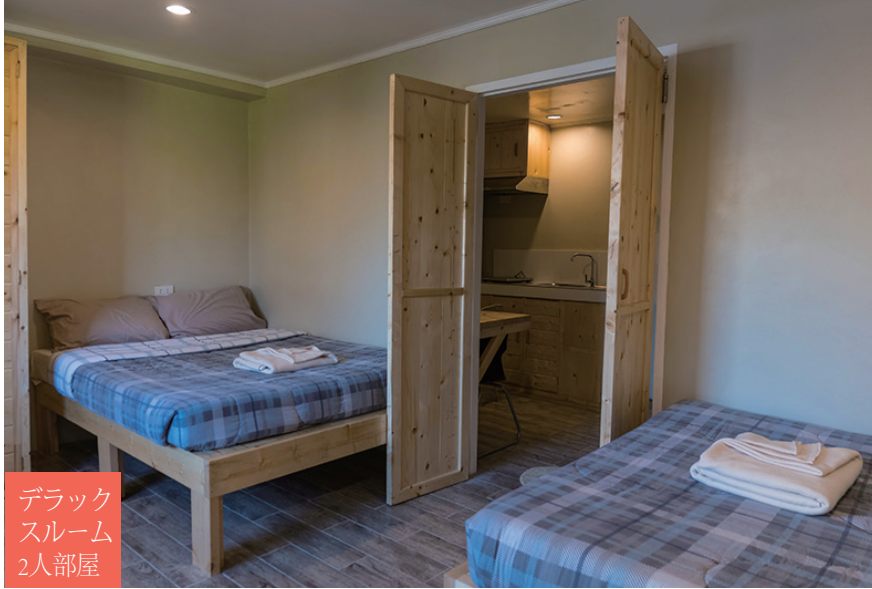
デラックス スルーム 2人部屋

Monolは、バランスのとれた学校生活をサポートするために、不可欠で基本的なサービスを維持し、さらに向上させることに努めています。これらのサービスを最高の品質で提供することで、学生は留学中、便利で快適な滞在を送ることができ、勉強に専念することができます。