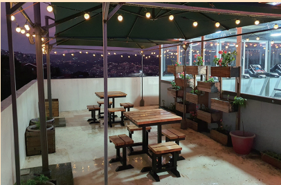
屋上のピクニックエリア