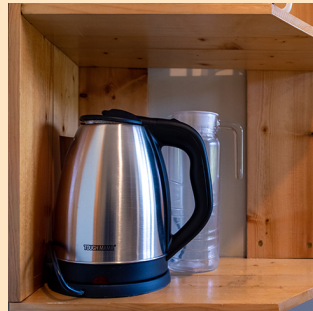
湯沸かし器、ピッチャー