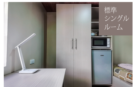
標準 シングル ルーム