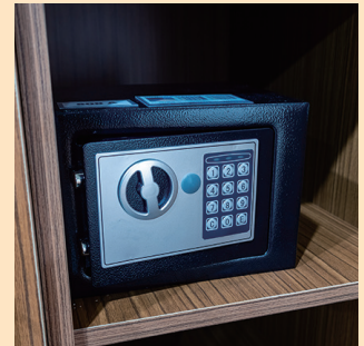
セーフティーボックス