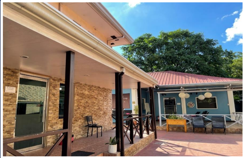
Student Support Center