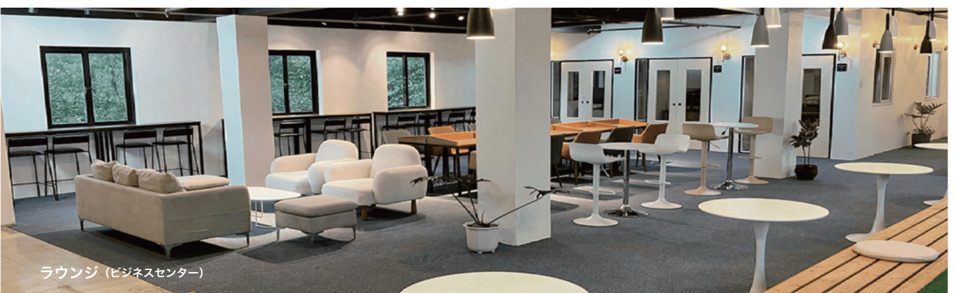
ラウンジ (ビジネスセンター)