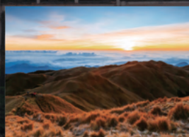
本格的な登山が楽しめる マウント・ブラグ