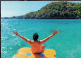
シュノーケリングが楽しめる ハンドレッドアイランド

バギオ市内には遊びの誘惑は少ないですが、周囲にはビーチリゾートや世界遺産など魅力的な観光地がたくさんあります。せっかくの海外留学、週末は仲間と一緒に観光を楽しみましょう。