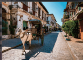
16世紀の街並みが残る世界遺産 ピガン