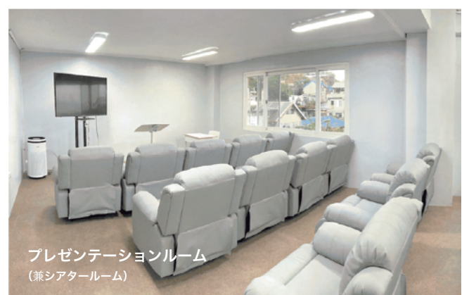
プレゼンテーションルーム (兼シアタールーム)