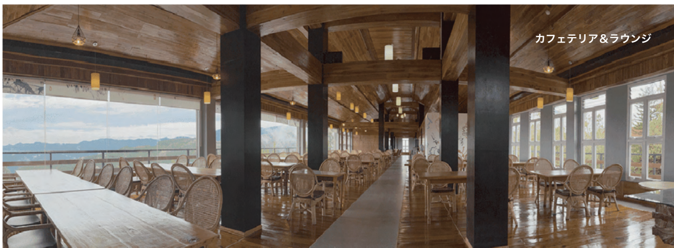
カフェテリア&ラウンジ