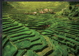
天国への階段の異名を持つ世界遺産 バナウェの棚田