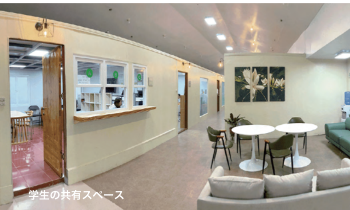
学生の共有スペース