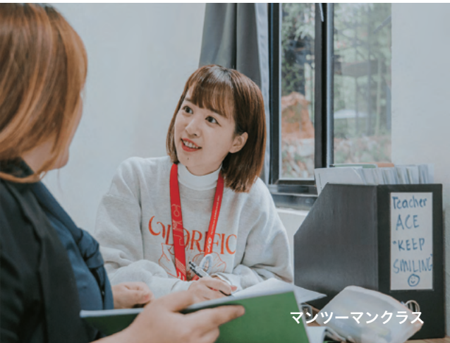
マンツーマンクラス