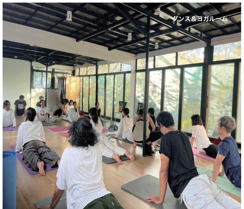
ダンス&ヨガルーム