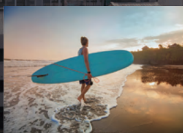
サーフィンを楽しめる サンフェルナンドビーチ