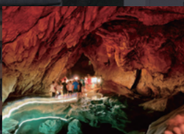
洞窟探検が楽しめる サガダ