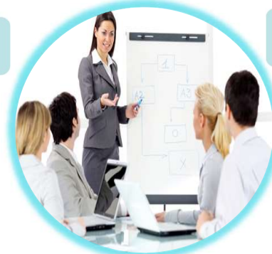
プレゼンテーション