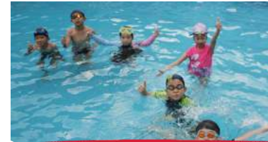
3 スイミングアクティビティ