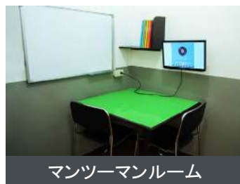
マンツーマンルーム