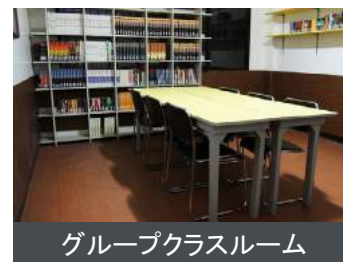
グループクラスルーム