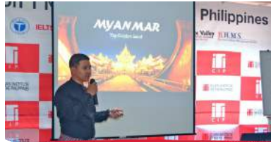
1 EOP チャレンジプログラム