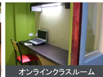
オンラインクラスルーム