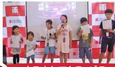
10 カラオケアクティビティ