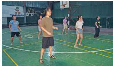
5 ダンスアクティビティ