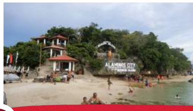
9 アイランドホッピング