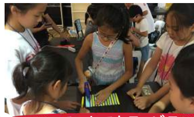
14 アートアクティビティ