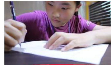
7 スペリングコンテスト