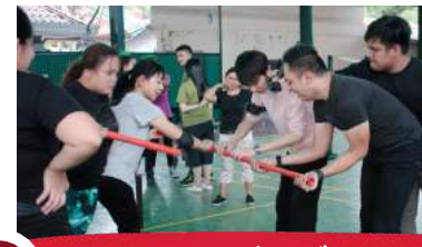
11 アメージングレース