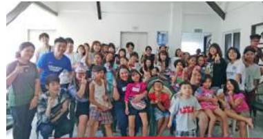
2 孤児院ボランティア