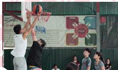
13 スポーツトーナメント