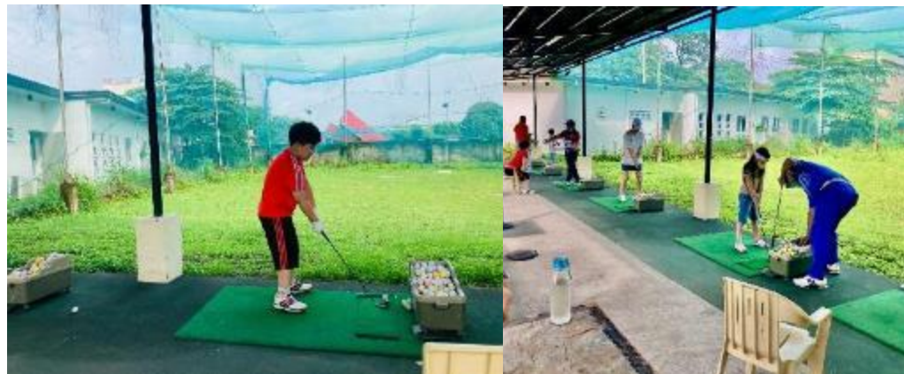
WE ACADEMYキャンパス内のゴルフ練習場