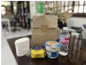
到着時の無料ウェルカムセット