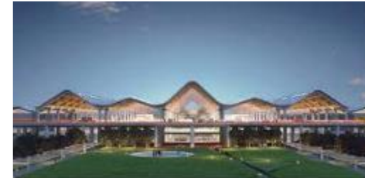
クラーク新国際空港