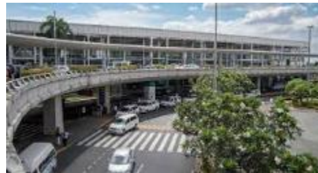
マニラ国際空港（ターミナル2）

コロナ前までもクラーク⇄マニラ北部間は高速道路が開通していたものの、マニラの中心部にあるマニラ国際空港から高速道路路間の渋滞がひどく、マニラ⇄クラーク間は2時間～、渋滞状況によっては4時間かかっていました。その後、2020年に『SKYWAY』という高速道路がマニラ国際空港近くからクラーク間全面開通したことで、現在は安定してマニラ国際空港⇄クラーク間の移動は片道約2時間（最速1時間40分）で可能となっています。