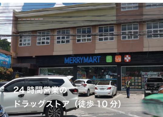
24時間営業の ドラッグストア (徒歩 10分)