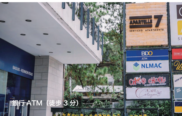
銀行ATM (徒歩 3分)