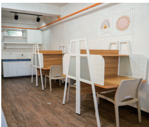
スタジオタイプ4人部屋（学習机）