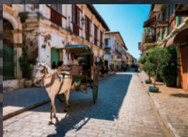
16世紀の街並みが残る世界遺産 ビガン