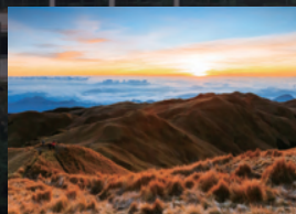
本格的な登山が楽しめる マウント・プラグ