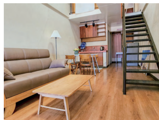
ロフトタイプ部屋（1階リビング）