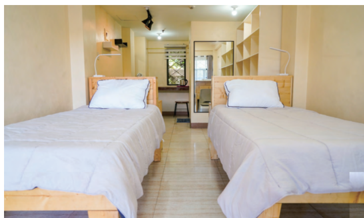
スタジオタイプ2人部屋