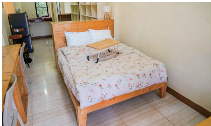
スタジオタイプ1人部屋 / カップル部屋