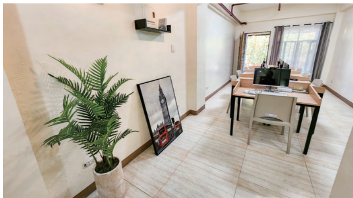
コンピュータールーム