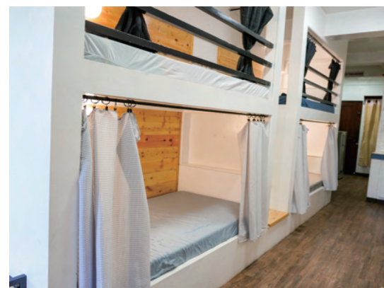
スタジオタイプ4人部屋（ベッド）