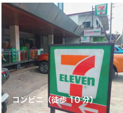
コンビニ (徒歩 10分)