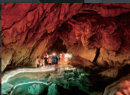
洞窟探検が楽しめる サガダ