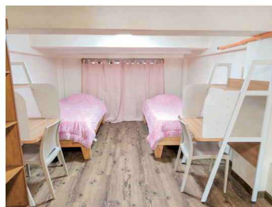
ロフトタイプ部屋（2階寝室）