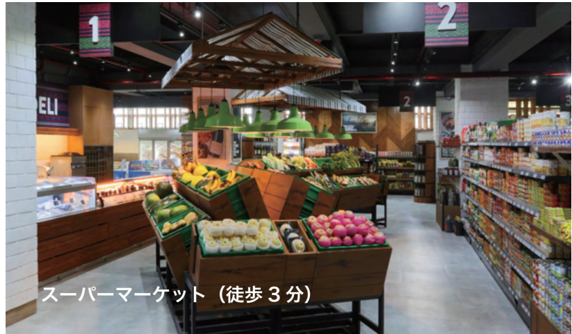
スーパーマーケット (徒歩 3分)