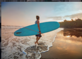
サーフィンが楽しめる サンフェルナンドビーチ