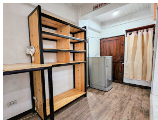
スタジオタイプ4人部屋（設備）