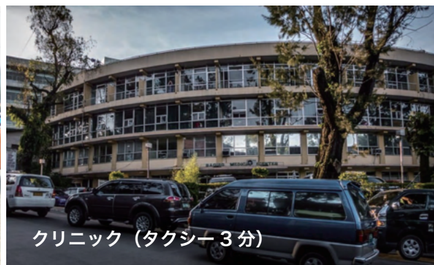
クリニック (タクシー 3分)